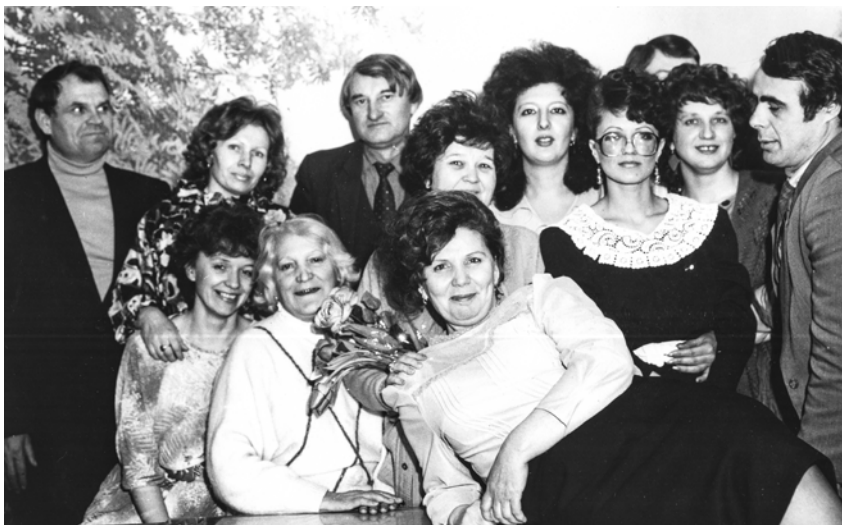
5 марта 1988 г.