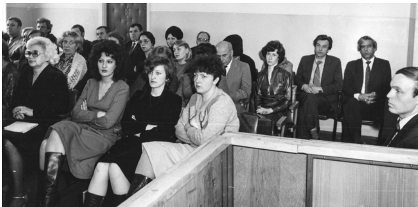
Общее собрание коллегии, февраль 1986

24 августа 1961 г. в Карагинском районе была открыта юридическая консультация Камчатской областной коллегии